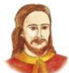
Kníže Vratislav I. (syn Bořivoje I. a otec svatého Václava)

Po několika letech se vlády ujal Václav . Byl velmi vzdělaný. Jeho babička Ludmila ho naučila číst a psát, což tenkrát uměl málokdo.