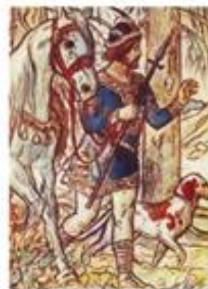
Kníže Oldřich na lovu (kresba Mikoláše Aleje)

Kníže Břetislav se snažil skoncovat s boji o vládu. Proto určil, že po smrti panovníka má nastoupit na trůn nejstarší člen rodu.