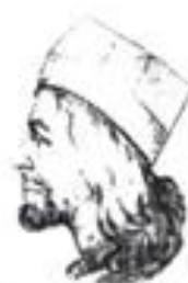
Svatý Václav (rekonstrukce podoby podle dochované lebky)

Václav i jeho babička Ludmila byli církví prohlášeni za svaté . Kníže Václav byl spravedlivý a mírumilovný, často obdarovával chudáky. V dobách zlých pro náš národ se lidé obraceli k svatému Václavovi jako ke svému patronovi (ochránci). Památku svatého Václava si připomínáme státním svátkem dne 28. září .