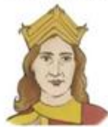
Vratislav II., první český král

Břetislav měl několik synů. Nejúspěšnějším z nich byl Vratislav II. Ten roku 1085 získal od německého císaře za pomoc ve válce královský titul (jen pro svoji osobu, nikoliv pro své nástupce). Vratislav II. se tak stal prvním českým králem. Do té doby měli čeští vládcové jen knížecí titul.