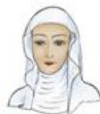
Svatá Ludmila (manželka Bořivoje a babička svatého Václava)