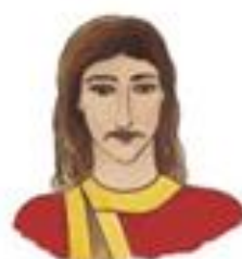
Kníže Bořivoj (první písemně doložený český kníže)

Za vlády Bořivoje I. bylo knížecí sídlo umístěno na Pražský hrad , kde byl také založen kostel .