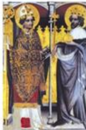
Svatý Vojtěch na dobovém obraze (relevo)