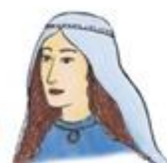
Kněžna Drahomíra, (manželka Vratislava I. a matka svatého Václava)